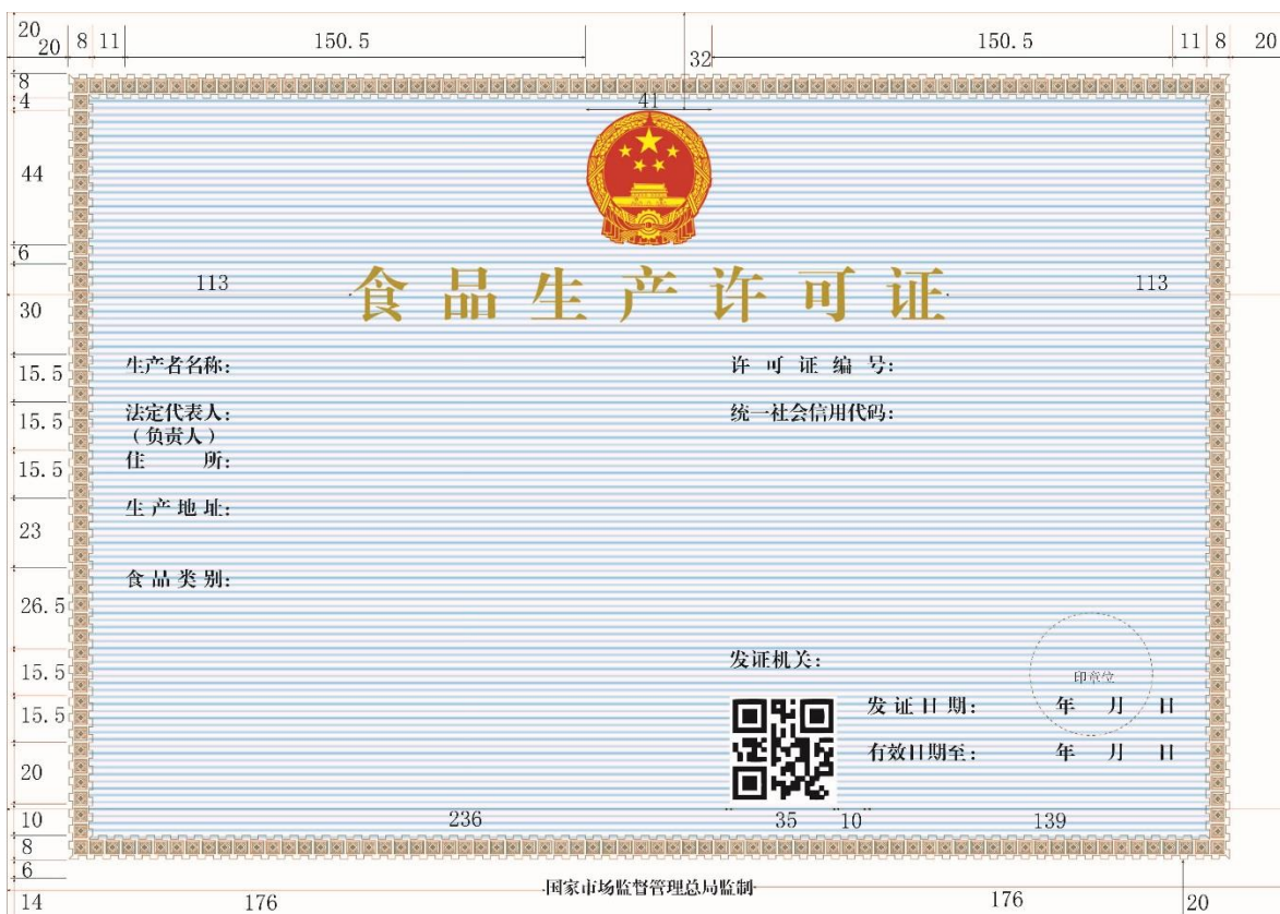
图 2 食品生产许可证正本式样