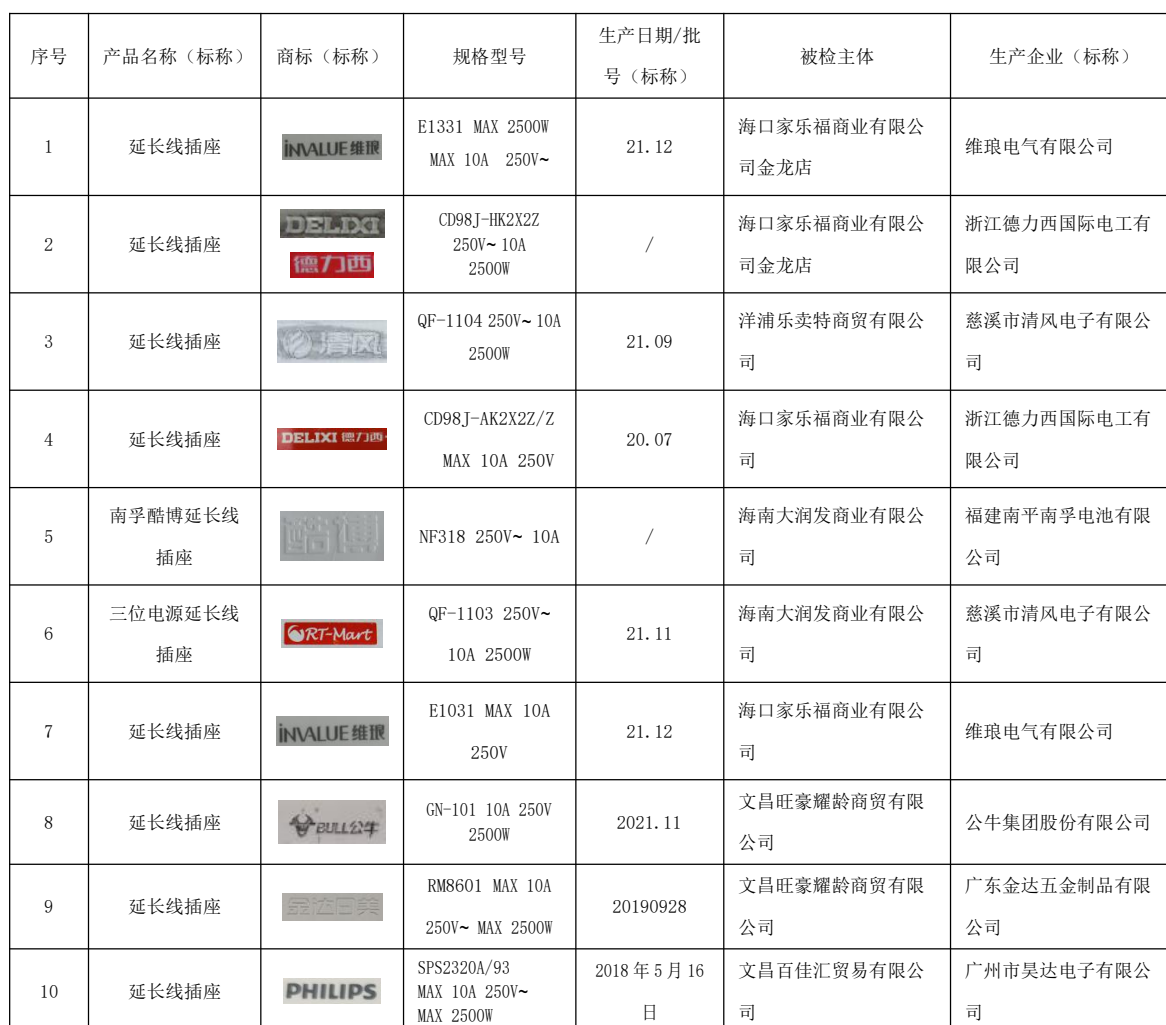
2022年海南省流通市场延长线插座产品质量监督抽查所检项目符合相关标准的产品