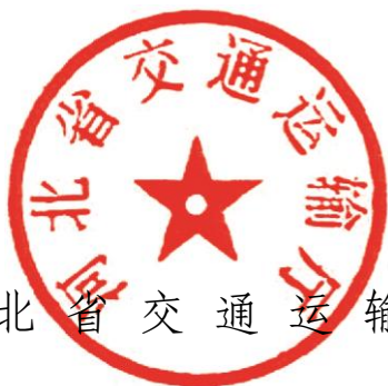
河北省交通运输厅