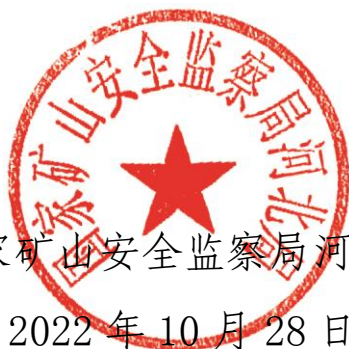
国家矿山安全监察局河北局