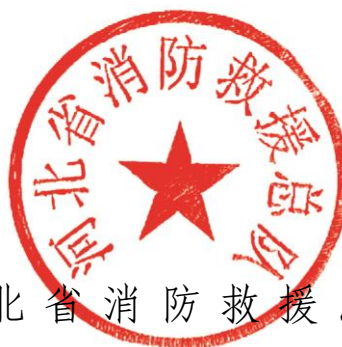
河北省消防救援总队