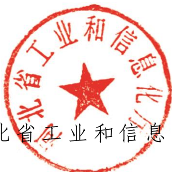
河北省工业和信息化厅