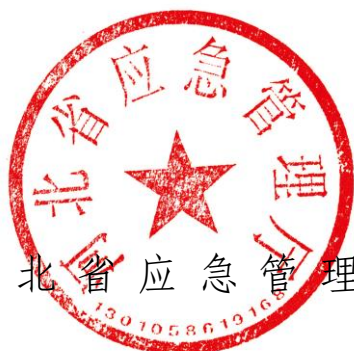
河北省应急管理厅

为强化安全生产举报和奖励工作，省应急管理厅、省发展和改革委员会、省工业和信息化厅、省财政厅、省自然资源厅、省住房和城乡建设厅、省交通运输厅、省农业农村厅、省市场监督管理局、省消防救援总队、国家矿山安全监察局河北局联合制定了《河北省安全生产举报和奖励办法（试行）》，并经省政府同意，现印发你们，请认真抓好贯彻落实。