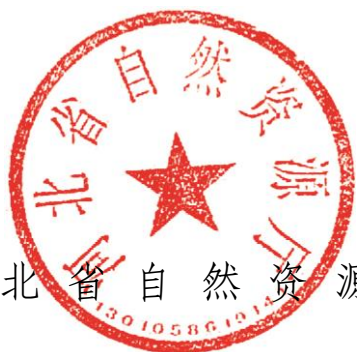
河北省自然资源厅