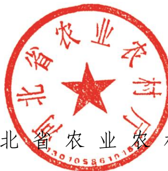
河北省农业农村厅