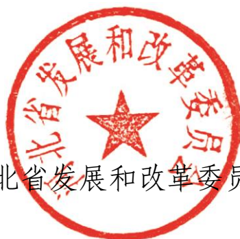
河北省发展和改革委员会