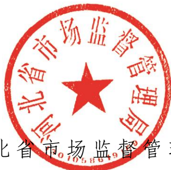
河北省市场监督管理局